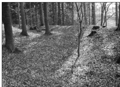
Zbytky příkopu a valu k jihovýchodu