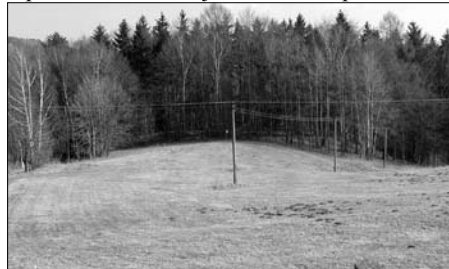
Pohled od silnice na lesík skrývající pozůstatky hradu...

V severní části katastru Nekoře (parc.č. 718/1 a 754/1) na skalnatém ostrohu strmě spadajícím k pravému břehu Divoké Orlice (vodní nádrže tzv. Malé přehrady) cca 400 m jižně od hráze Pastvínské přehrady jsou skromné zbytky nevelkého neznámého hradu. Na severu a jihu ostroh strmě spadá do skalnatých strží, které se táhnou až k břehům Malé přehrady. Severní strží prochází zpevněná cesta k přehradní hrázi, v jižní strži nad pramenem vody stojí malá kaplička. (Místo nazývané V Šancích)