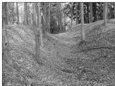
Hradní příkop - pohled k severní strži