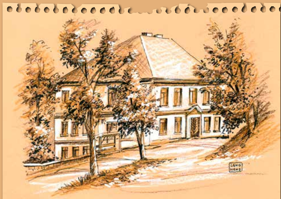
Nekořské obecní budovy historickým pohledem Pavla Langhans